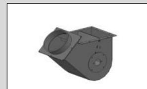
Elevatorfuß für dosierten Zulauf